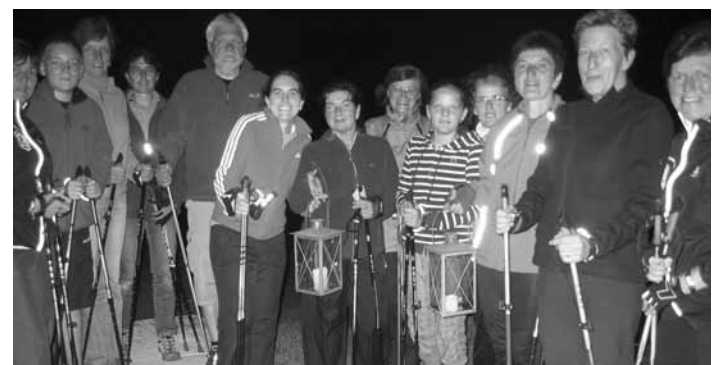
Gute Laune beim Vollmond-Nordicwalking