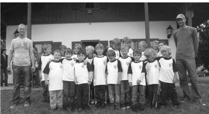
Die G-Jugend mit ihren neuen T-Shirts