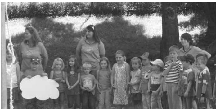
Die Kindergartenkinder bei ihrem Begrüßungslied