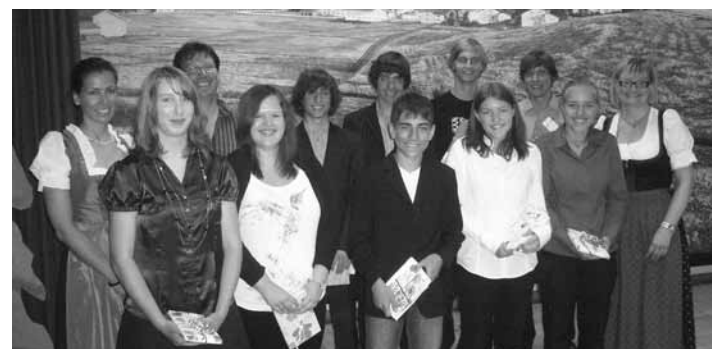
Die drei Klassenlehrer mit ihren besten Schülern.