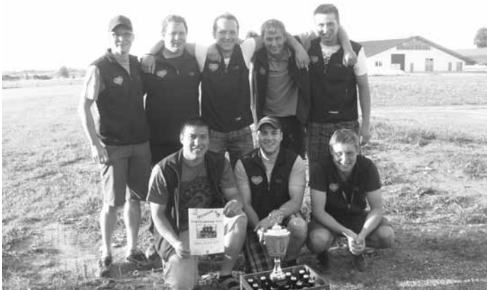
Sieger des Dorfturniers - Team Terrorgolf