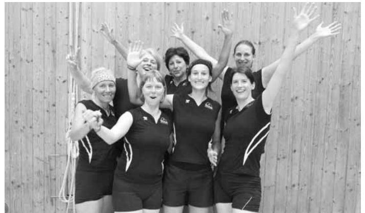
Stolze Volleyballmädels sind Meister der Allgäuer Eichenkreuzliga