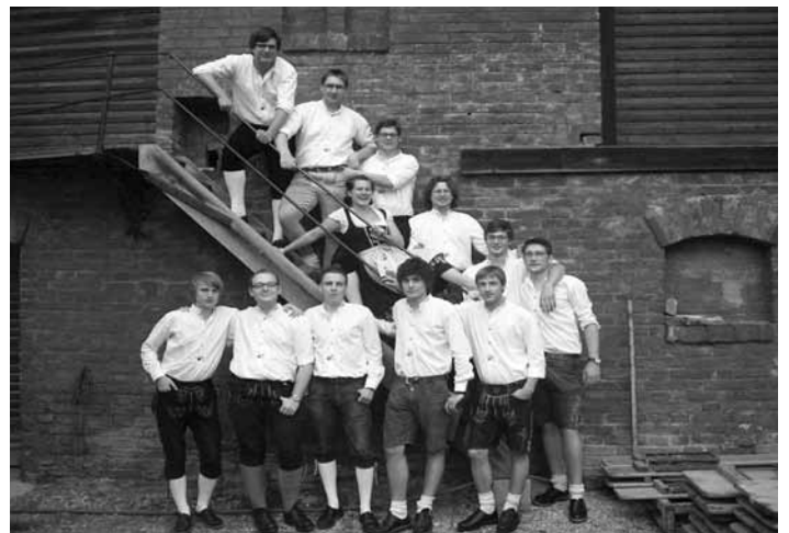
Die Muckasäck sorgen für Stimmung am Weinfest in Roßhaupten

Für alle Musik- und Weingenießer veranstaltet der Förderverein der Musikkapelle Roßhaupten am Wochenende vom 3./4. September das traditionelle Weinfest im Festzelt „Am Roten Kreuz“. Am Freitag, den 03. September steigt für alle Jungen und Junggebliebenen ab 20 Uhr die »Late-Summer-Night-Party« mit den WAIDIGEL. Hinter diesem Namen verbirgt sich bekanntermaßen Party pur und Superstimmung.