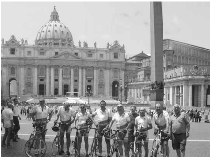
Von St. Andreas zum Petersdom. Ein super Erlebnis