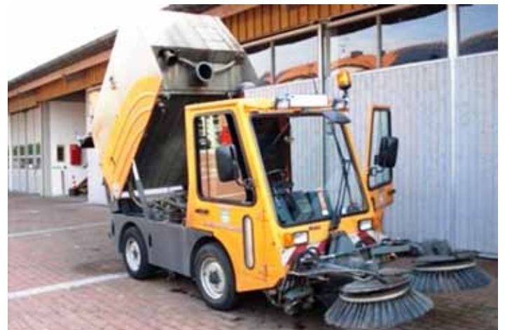
Vorsicht, unsere „Neue“ hat's in sich: wenn's sein muß, saugt sie auch „unachtsame“ Bürger mit auf...