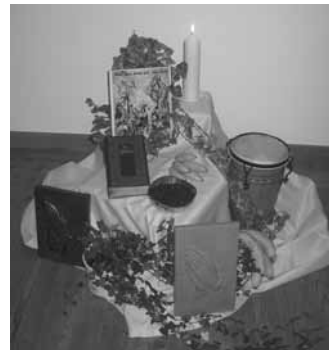
1. Weltgebetstag im Pfarrheim in Roßhaupten

Den Weltgebetstag am 5. März gestalteten wir mit evangelischen und katholischen Frauen in diesem Jahr zum ersten Mal im Pfarrheim. 28 Gläubige und 14 Mitwirkende haben sich bei Gebeten und Liedern, die dieses Jahr Frauen aus Kamerun vorbereitet haben, recht wohlgeföhlt. Dadurch, dass wir Alle enger beisammen gesessen sind, ist eine vertraute Atmosphäre entstanden. Beim anschließenden gemütlichen Beisammen sein gab's wie jedes Jahr Brezeln, Eier und verschiedene Getränke. Allen Helferinnen ein „Danke schön“.