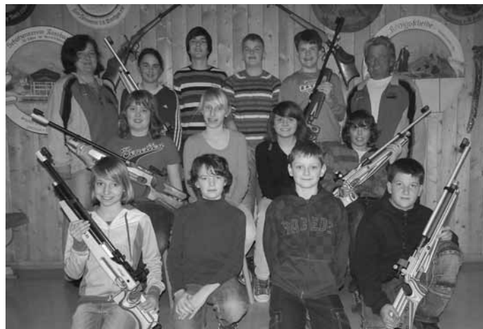
Die stolze Jugend präsentiert ihre Gewehre