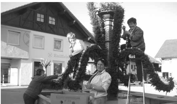
Fleißige Hände beim schmücken der Osterbrunnen

Am 22. März haben sich ca. 20 Frauen im Bauhof der Gemeinde getroffen. Viele fleißige Hände haben für die 2 Brunnen am Dorfplatz und bei der Raiffeisenbank Girlanden gewunden und mit bunten Eiern geschmückt. Durch diesen alten Brauch wird auch unser Dorf zu Ostern etwas bunter und schöner. Wir bedanken uns bei allen Helferinnen recht herzlich.