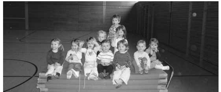
Fleißige Helfer beim Aufräumen