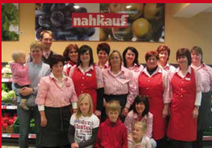
Ihr Team vom nahkauf Hummel Roßhaupten