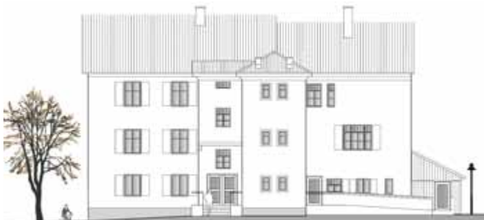
Unsere Alte Schule: die charakteristische Außenansicht bleibt erhalten. Hinzu kommen ein großzügiger Eingang, eine Rampe für barrierefreien Zutritt zum Erdgeschoß und ein Behinderten-WC im Stadel auf der Westseite

Schwerpunkt des Konjunkturpakets ist die energetische Sanierung der „Bildungs- und Begegnungsstätte Alte Schule“. Dazu gehört ein Vollwärmeschutz, neue Fenster sowie eine neue Heizung. Des „Kaisers neue Kleider“ bleiben jedoch weitgehend unsichtbar, der eigene Charakter des Dorfbild prägenden Gebäudes soll in jedem Fall erhalten bleiben.