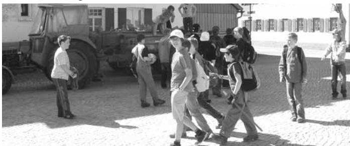
Müllsammeln kann auch Spaß machen... Hauptschule und Landwirte – ein eingespieltes Team

Schon fast traditionell stand der letzte Schultag vor den Osterferien wieder für die Aktion Sauberes Ostallgäu. Die gesamte Grundschule sammelte im Nahbereich im und ums Dorf herum, die Hauptschule mit zwei Klassen wurde von freiwilligen Landwirten mit Traktoren unterstützt und nahm in einem größeren Radius den rumliegenden Müll unter die Lupe. Die übrigen Klassen der Hauptschule wollen sich bis zum Sommer an der Bekämpfung des Indischen Springkrauts beteiligen.