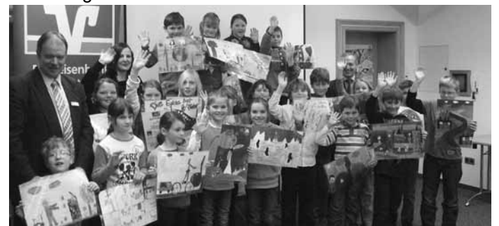
Die Sieger des Malwettbewerbes der Raiffeisenbank Südliches Ostallgäu eG