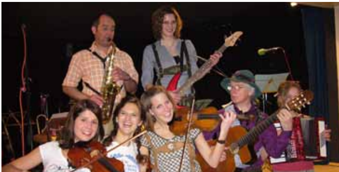
Beste Stimmung beim „Luaderleabe“ im Gasthaus Post