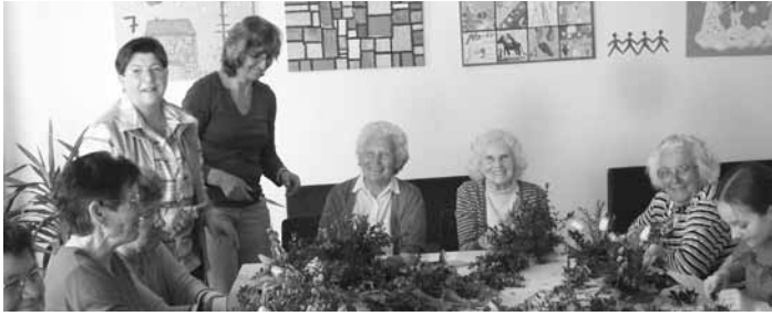
Reges Treiben im MGH beim Osterbasteln