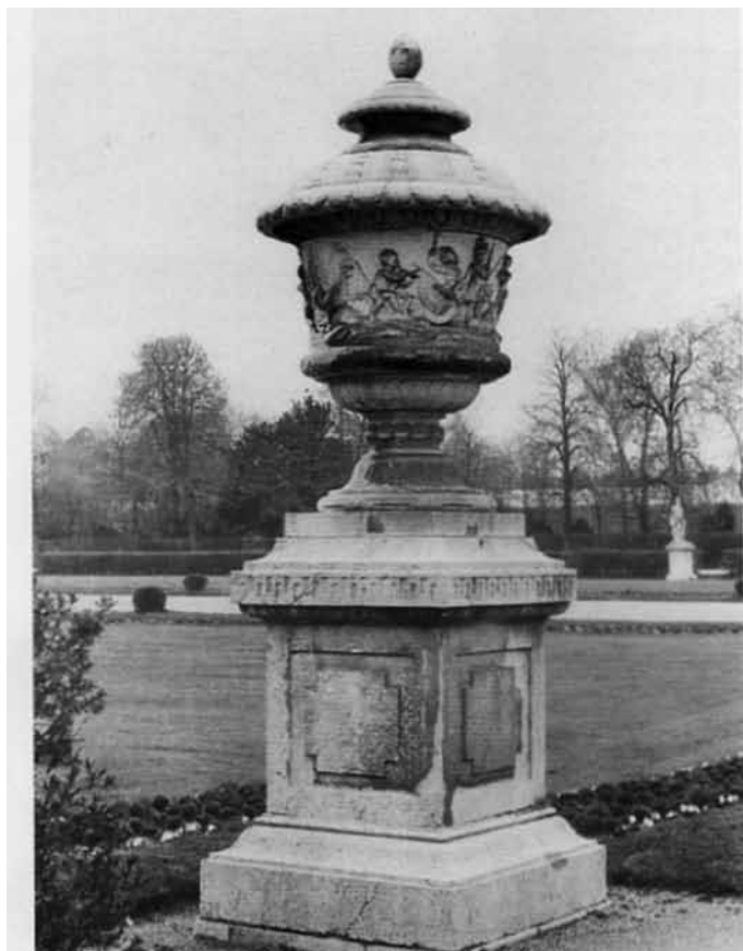
Marmorvase H. ca. 230 cm (1788-98) (Nymphenburger Schlossgarten)