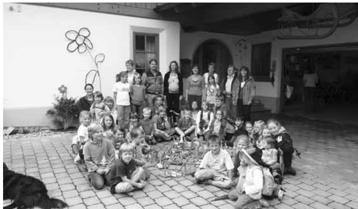
Stolz präsentieren die Kinder Ihre Drachenboote

Mit großem Eifer und einer Riesenfreude verwandelten sich 31 Kinder beim Abschlusstag der SommerFerienAkademie 2010 von Mitanand Roßhaupten zu Kapitänen. Ihre Drachenboote – von ihnen selbst bunt bemalt - schwammen auf dem Gruberbach, führten eigenwillige Manöver in den unterschiedlichen Bachströmungen aus und landeten nach einer Seefahrt von rund 50 Metern in einem Käscher. Den Kapitänen zurückgegeben, sausten diese sofort wieder zum Startplatz und begleiteten, voller Eifer, am Ufer neben ihrem Drachenboot dahin rennend, dieses wieder bis hin zum Käscher-Hafen.