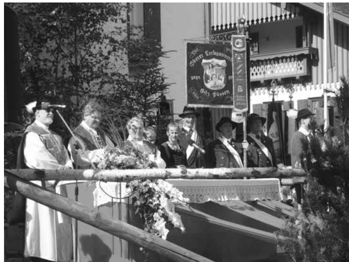
Festgottesdienst am Festsonntag

Tracht ein tiefes Gefühl der Zusammengehörigkeit da. Das Fundament, auf dem wir fest stehen, die Grundlage unseres Lebens und Strebens nach Heimat und Geborgenheit ist dabei der Glaube an den dreifaltigen Gott, das Gebet, die vertraute Zwiesprache mit Gott. Die musikalische Gestaltung des Gottesdienstes übernahmen auf sehr gekonnte Weise der Männerchor Roßhaupten und die Festkapelle. Auch dem Männerchor danken wir für den Probenfleiß und die schöne Gestaltung dieses Gottesdienstes. Ein Trachtenpaar legte anschließend zum Stück des Guten Kameraden einen Kranz für alle Verstorbenen am Birkenkreuz nieder.