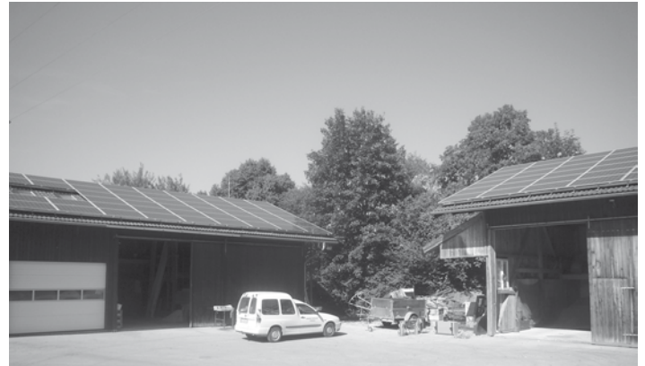
Sonne für Roßhaupten – hier die Anlage auf dem Bauhof. Ab jetzt zählt jede Sonnenstunde „doppelt“ für unsere Gemeinde.