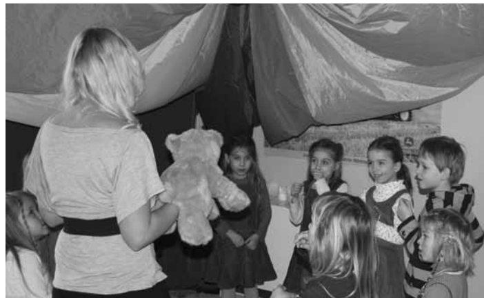
So macht Englisch lernen Spaß!