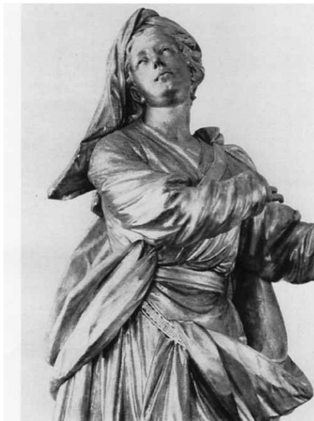
Immaculata Lindenholz, H 216 cm (1779/80) (Bayer. Nationalmuseum)