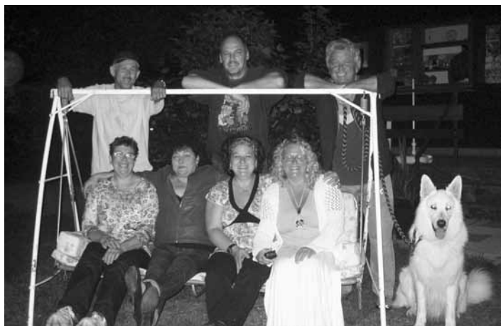
Mit gemütlichen Abenden in der Wette verbrachten die Schützen ihre Sommerpause

Bevor die Sommerpause des Schützenvereins für diese Saison zu Ende geht, trafen sich einige Schützinnen und Schützen und verbrachten einen der letzten, wenigen, lauen Abende in der Wette. Bei guter Stimmung und bester Bewirtung durch Elfriede, wurde es ein gelungenes Treffen. Für die neue Schießsaison wünschen wir allen Teilnehmern einen erfolgreichen Start.