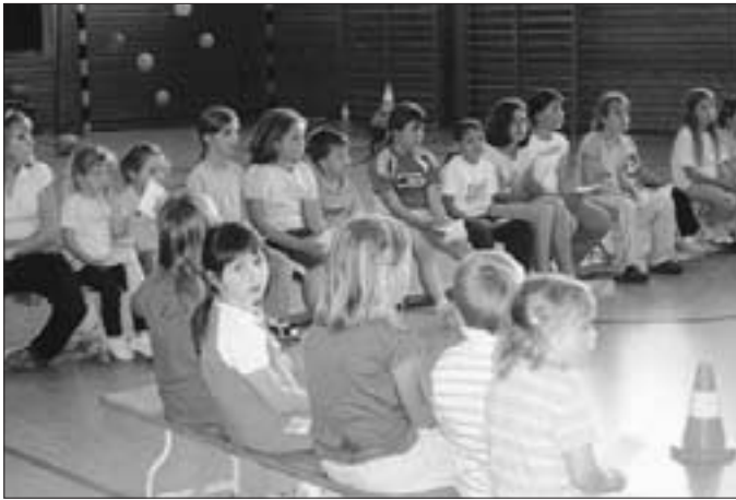
Kurze Einführung und Erklärung der Stationen und Verteilen der Turnpässe